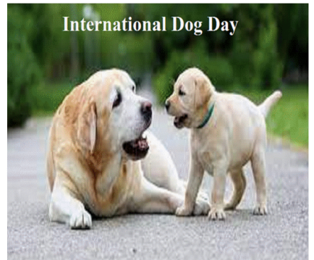
International Dog Day

(B) अंतर्राष्ट्रीय कुत्ता दिवस हर साल 26 अगस्त को मनाया जाता है। यह दिन सभी कुत्तों को उनकी नस्ल, आकार आदि की परवाह किए बिना मनाने के लिए मनाया जाता है। यह लोगों को पालतू जानवरों की दुकानों से खरीदने के बजाय कुत्तों को अपनाने के लिए प्रोत्साहित करने के लिए भी मनाया जाता है। अंतर्राष्ट्रीय कुत्ता दिवस की स्थापना 2004 में की गई थी।